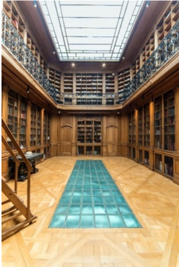
Grande salle de lecture de la Bibliothèque Smith-Lesouëf