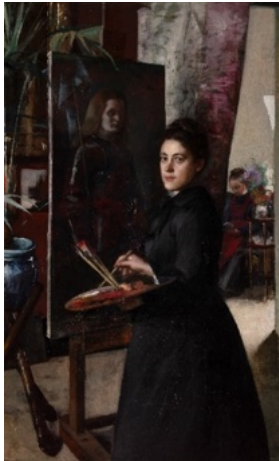
Otilie ROEDERSTEIN, Portrait de Madeleine Smith peignant Jeanne d'Arc , 1890, huile sur toile, 197 x 131 cm, Nogent-sur-Marne, Fondation des Artistes, inv. 170