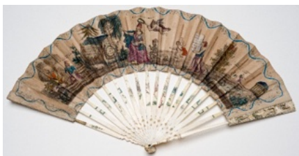
Anonyme, Éventail avec Génie de la Liberté , XVIII e siècle, gouache sur papier et ivoire, 26,5 x 49 cm, Nogent-sur-Marne, dépôt de la Bibliothèque nationale de France à la Fondation des Artistes, inv. Smith-Lesouëf 127