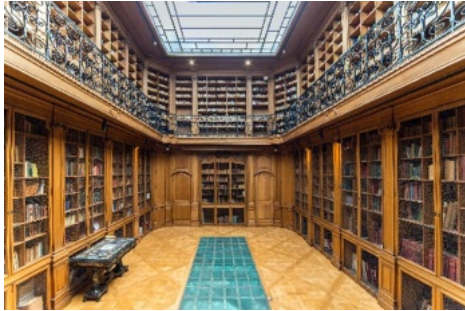
Grande salle de lecture de la Bibliothèque Smith-Lesouëf