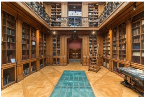
Grande salle de lecture de la Bibliothèque Smith-Lesouëf