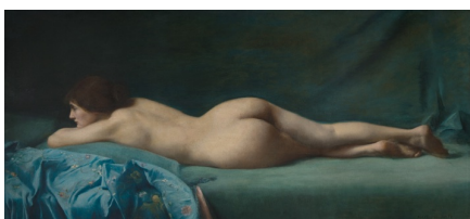
Madeleine SMITH, Nu au divan bleu , 1911, huile sur toile, 113 x 223 cm, Nogent-sur-Marne, Fondation des Artistes, inv. 181