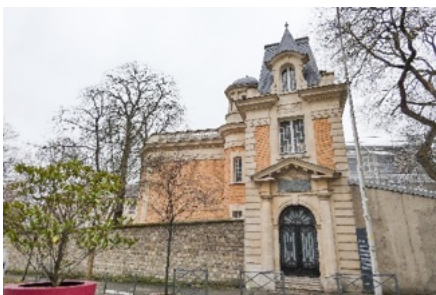
Façade de la Bibliothèque Smith-Lesouëf