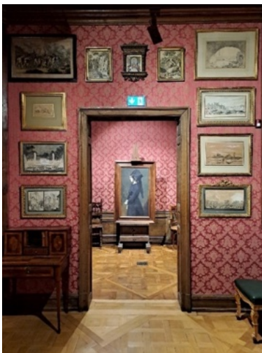
Première salle du musée de la Bibliothèque Smith-Lesouëf