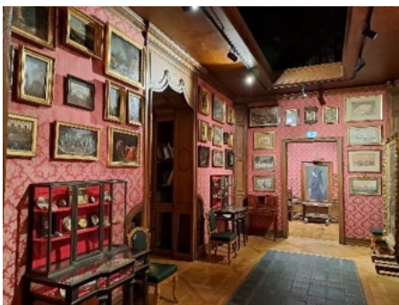
Première salle du musée de la Bibliothèque Smith-Lesouëf