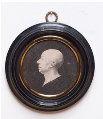
Anonyme, Portrait de Denis Diderot , XVIII e siècle, encre à la plume sur papier, diam. 8,7 cm, Nogent-sur-Marne, dépôt de la Bibliothèque nationale de France à la Fondation des Artistes, inv. Smith-Lesouëf 13