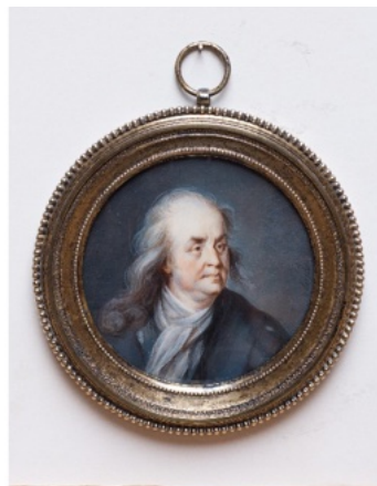
KOGLER, Portrait de Benjamin Franklin , gouache sur ivoire, 1780, diam. 10,5 cm, Nogent-sur-Marne, dépôt de la Bibliothèque nationale de France à la Fondation des Artistes, inv. Smith-Lesouëf 32