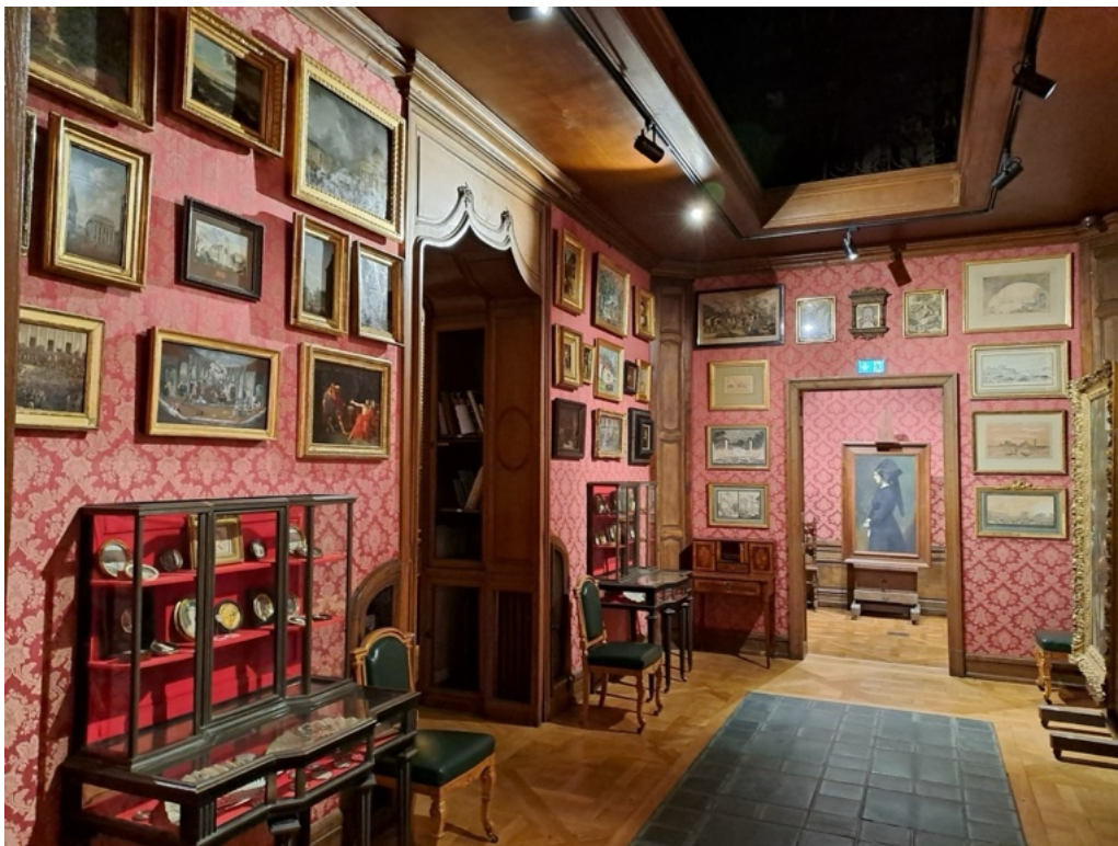
Première salle du musée de la Bibliothèque Smith-Lesouëf