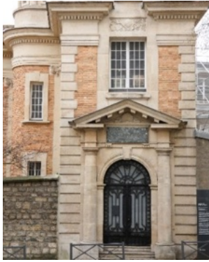
Façade de la Bibliothèque Smith-Lesouëf