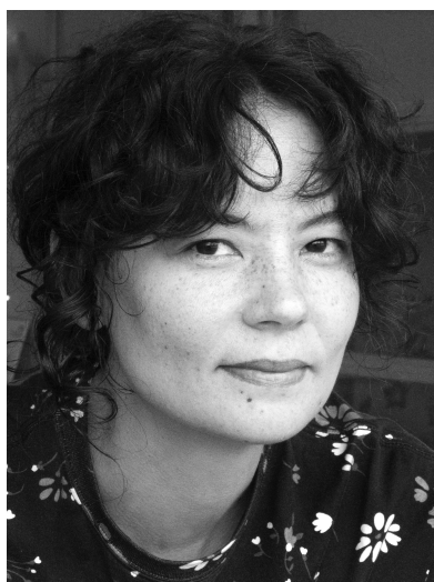
Sylvie Faur

Les rencontres que l'illustratrice Sylvie Faur dans Voyage a su y instaurer durant l'année 2024 sont restituées dans cet ouvrage de manière inédite et particulièrement sensible.